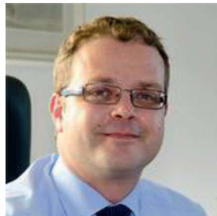
Il Sindaco Filippo Giacinti